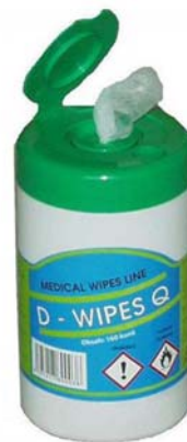
D-wipes Q 160