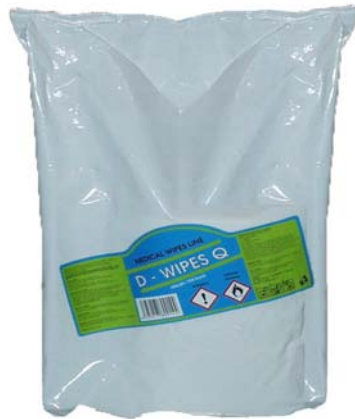
D-wipes Q 700 náhradní náplň

Používejte biocidní přípravky bezpečně. Před použitím si vždy přečtěte údaje na obalu a připojené informace o přípravku.