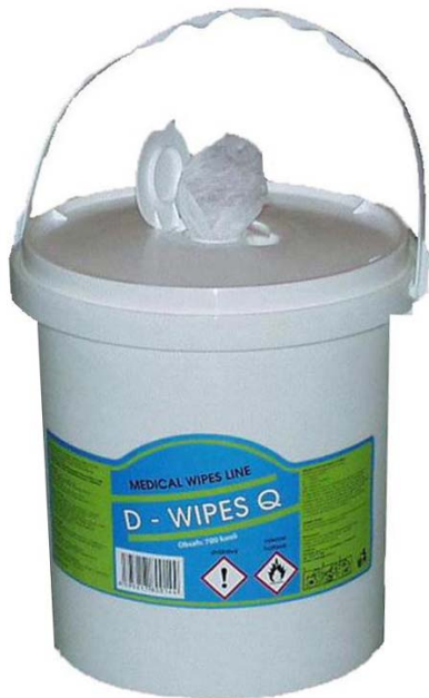
D-wipes Q 700